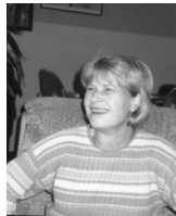
Das Connection Team